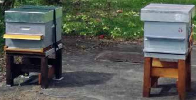
Les deux ruches du Centre Hospitalier de Plaisir, situées rue de la Boissière.