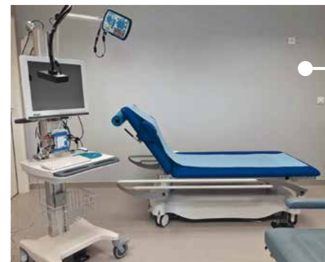
La salle de l'électroencéphalogramme.

(encéphalite, encéphalopathie), maladie de Creutzfeldt-Jacob mais aussi pour évaluer l'efficacité d'un traitement qui vient d'être introduit.