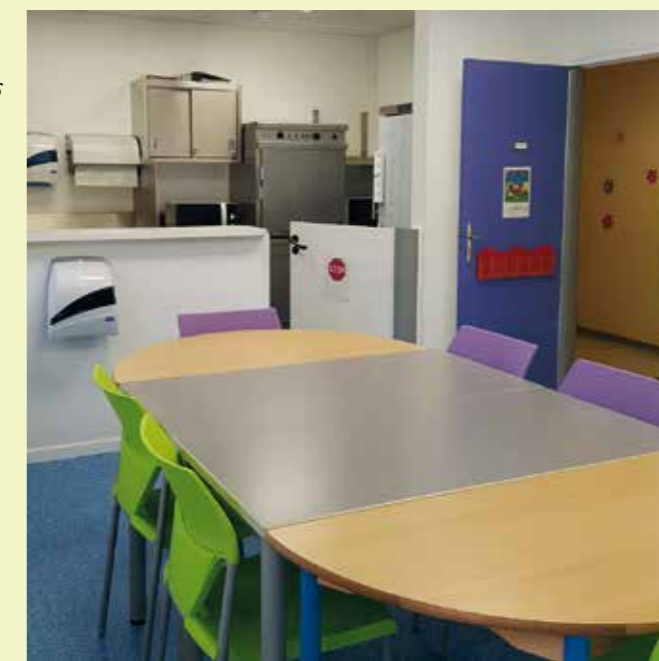
L'office alimentaire de l'Hôpital de jour L'Escale.

La proximité avec le Centre Médico-Psychologique Enfants et Adolescents de Maurepas, situé dans le même immeuble, facilite et dédramatise les orientations des enfants en Hôpital de Jour Enfants pour les familles.