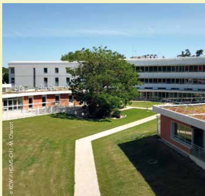
Le CMG, vue depuis les USN.

Merci aux différents acteurs mobilisés par l'emménagement dans ce nouveau bâtiment.