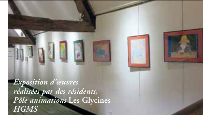
Exposition d'œuvres réalisées par des résidents, Pôle animations Les Glycines HGMS