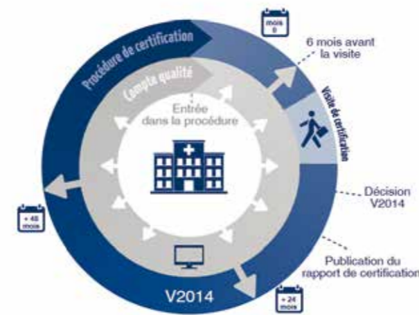
Déroulement de la procédure de certification V2014.

Schéma extrait du site de la HAS : https://www.has-sante.fr