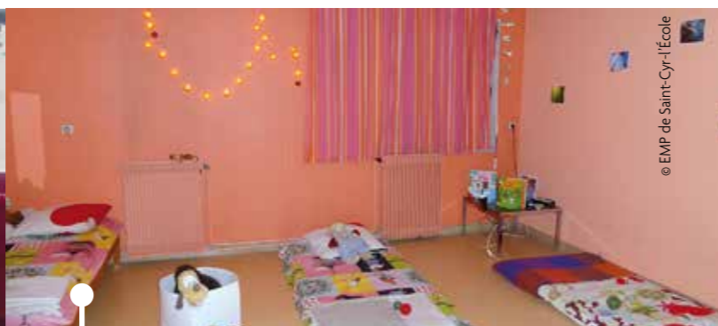
Le coin détente « tout doux ».

Le samedi 18 mars dernier, l'EMP de Saint-Cyr-l'École accueillait les familles des enfants de l'EMP et les partenaires à l'occasion de sa journée portes ouvertes. Pas moins de quarante personnes représentant les familles et dix-sept partenaires se sont succédés, c'est dire le franc succès de cette manifestation organisée par l'équipe pluridisciplinaire. Durant leur visite, familles et partenaires ont découvert les différentes activités proposées aux enfants ainsi que leurs œuvres.