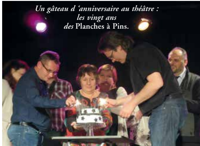
Un gâteau d'anniversaire au théâtre : les vingt ans des Planches à Pins.

Ensuite des morceaux choisis de son répertoire mêlant toujours humour, sérieux et dérision ont été joués devant un public conquis.