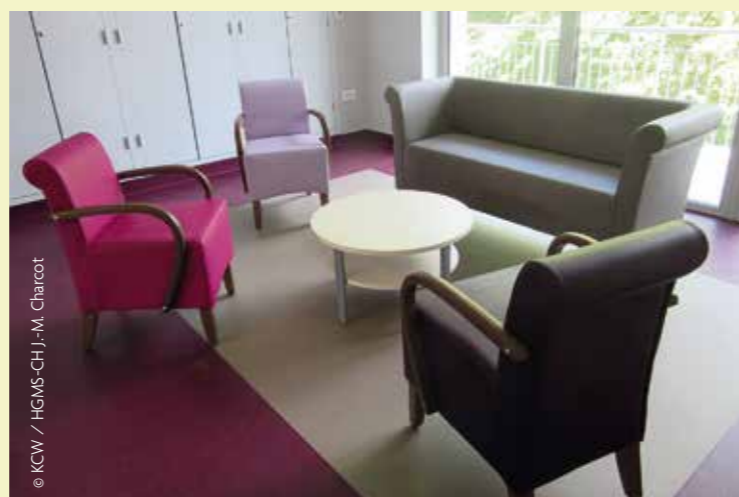
Un salon au CMG (Gériatrie Court séjour).

Les derniers travaux d'adaptation des locaux pour accueillir le service Médecine Physique et Réadaptation (MPR) sont achevés. L'entrée de l'Hôpital de jour MPR se fera à partir du hall d'entrée principal, côté droit. Dans le vaste espace de l'entrée du service MPR se trouve la banque d'accueil, son secrétariat, ainsi que l'espace détente comportant salons et salle à manger pour le déjeuner des patients. La grande salle de travail de réadaptation se trouve à l'angle du bâtiment côté « rond-point au cèdre ».