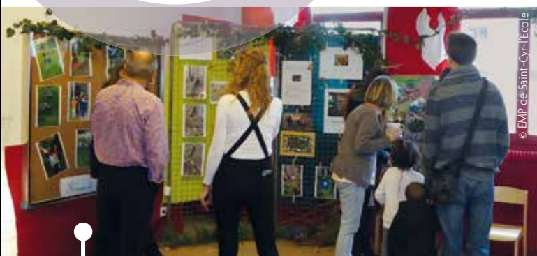
Salle d'accueil pour les enfants aménagée pour l'occasion en « pôle découverte de la nature / land'art ».

Par Sandrine CHAUVEAU, Cadre Socio-éducatif EMP Saint-Cyr-l'École