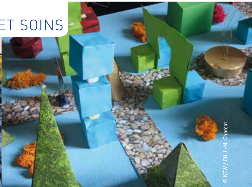
L'art topiaire selon un élève de l'école Ulysse.