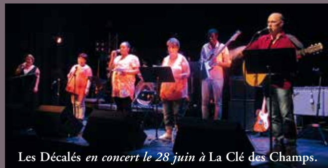
Les Décalés en concert le 28 juin à La Clé des Champs.

Le groupe était constitué cette année de cinq patients et deux soignants, musiciens et chanteurs. En cours d'année trois morceaux ont été enregistrés, avec l'aide d'un ingénieur du son. Avec les enregistrements des années précédentes, cela constitue une compilation de seize chansons, vendue au prix de quatre euros, reversés à l'association Aide et solidarité de La Pommeraie .