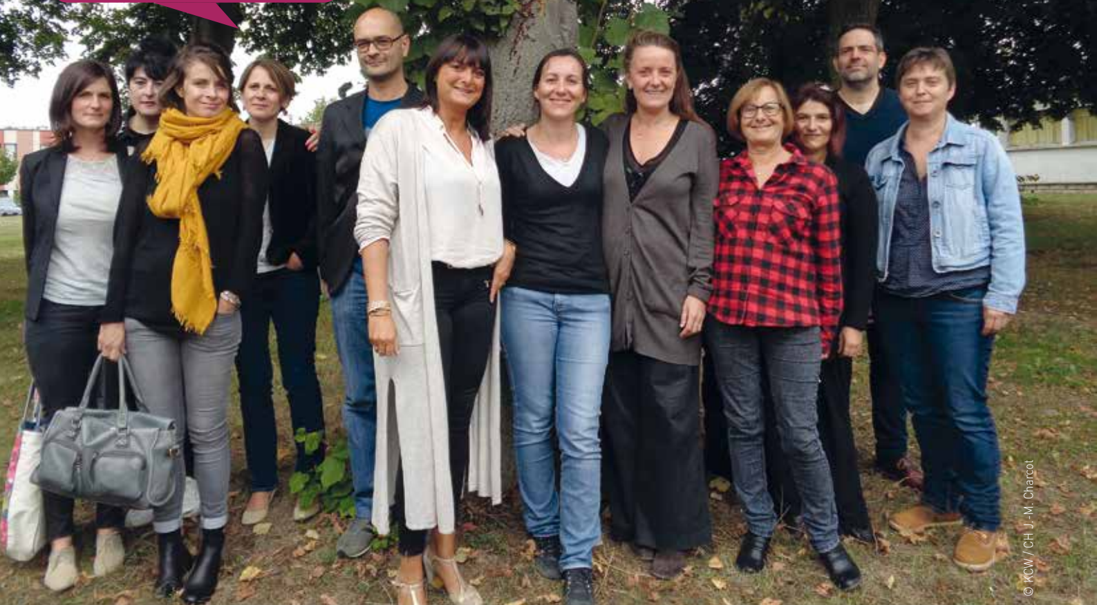
© KCW / CH J.-M. Charcot