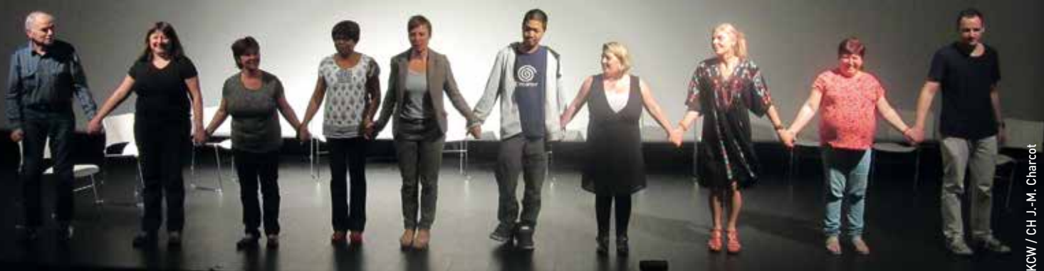
Représentation théâtrale du 24 juin à l'Espace Philippe-Noiret.